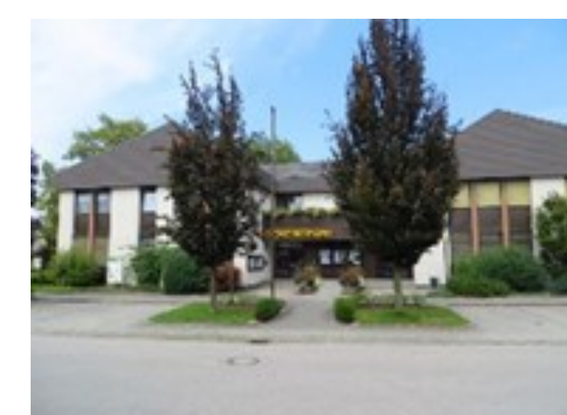
Unterkünfte der Gendarmerie: alte Schule, Pichl Nr.57, Pichl Nr.11, Gemeindeamt, Gemeindeamt neu