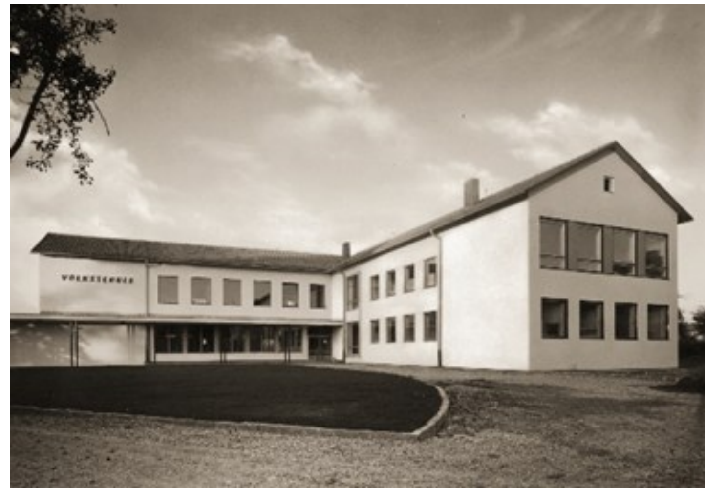
Die neue Volksschule 1963 eröffnet