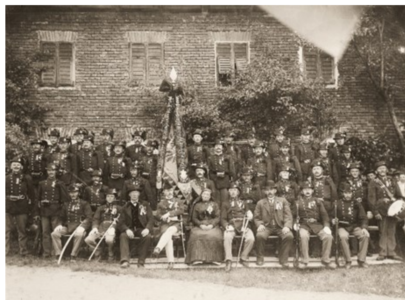
1917 Fahnenweihe des Schützenkorps

Die Gründung erfolgte 1814 als Bürgermusik. Im Jahre 1886 wurde der Musikverein Pichl gegründet und gleichzeitig erfolgte die Löschung vom Schützenkorps. Die Probelokale wurden im Laufe der Zeit oft gewechselt. 1972 wurde im neuen Feuerwehrzeughaus Pichl ein Musikheim eingerichtet. 2011 zieht der Musikverein ins neue Musikheim in der Brucknerstraße.