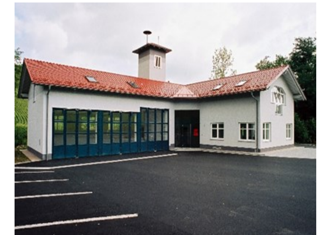
2001-2004 ausgebaut, Neugestaltung