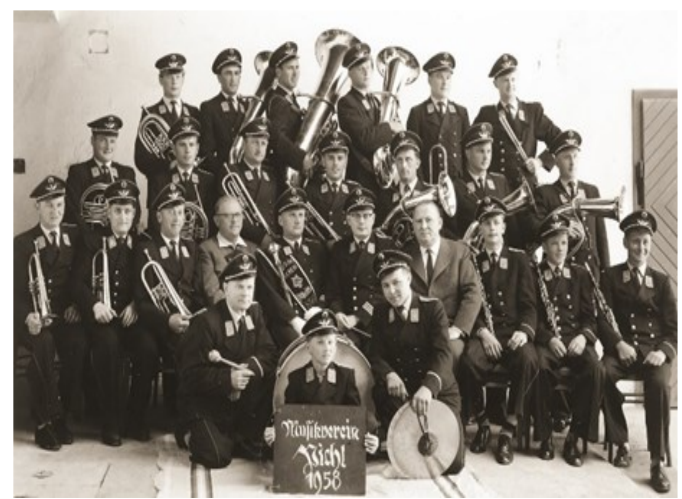
Musikverein 1958 in Uniform