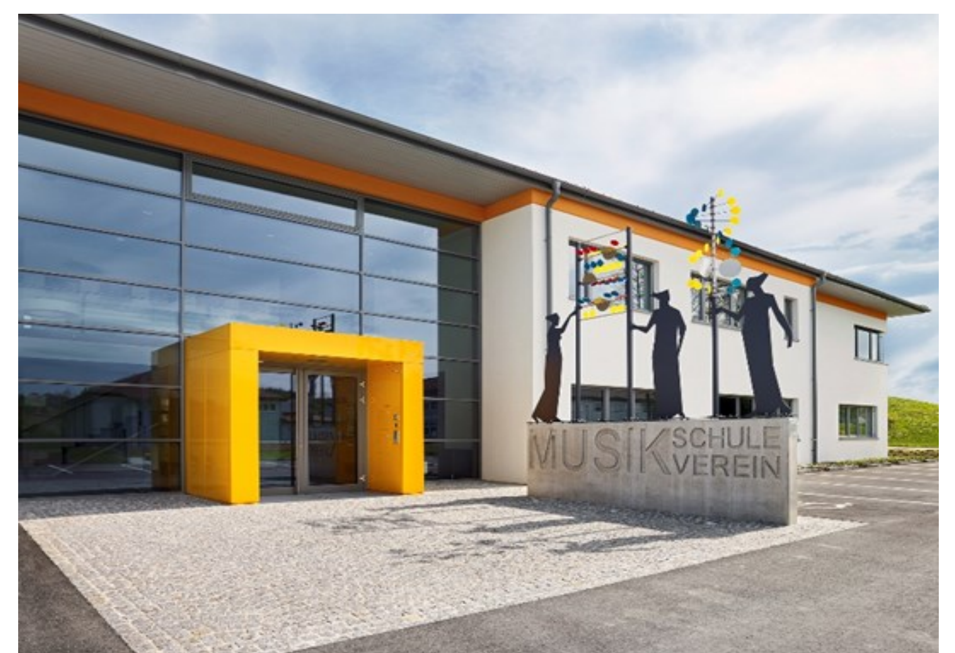
Seit 2011 ist das neue Haus für Musikschule und Musikverein in Betrieb