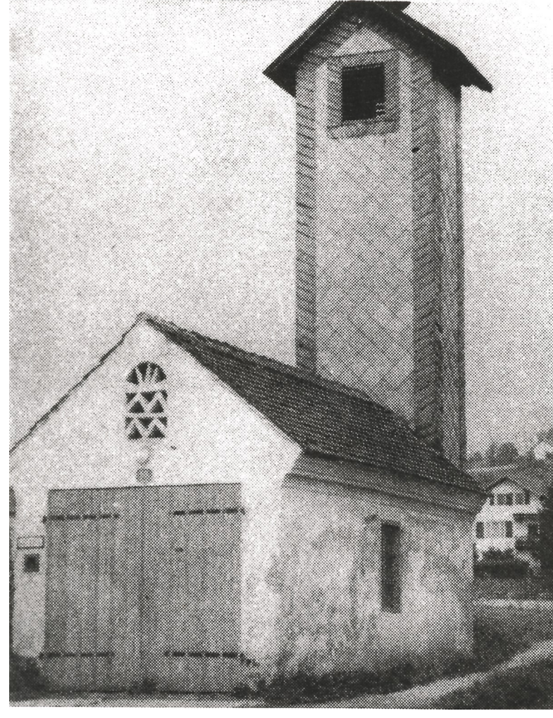
Erstes Zeughaus 1908

Mit dem heutigen Sparmarkt konnte ein Postpartner gefunden werden.