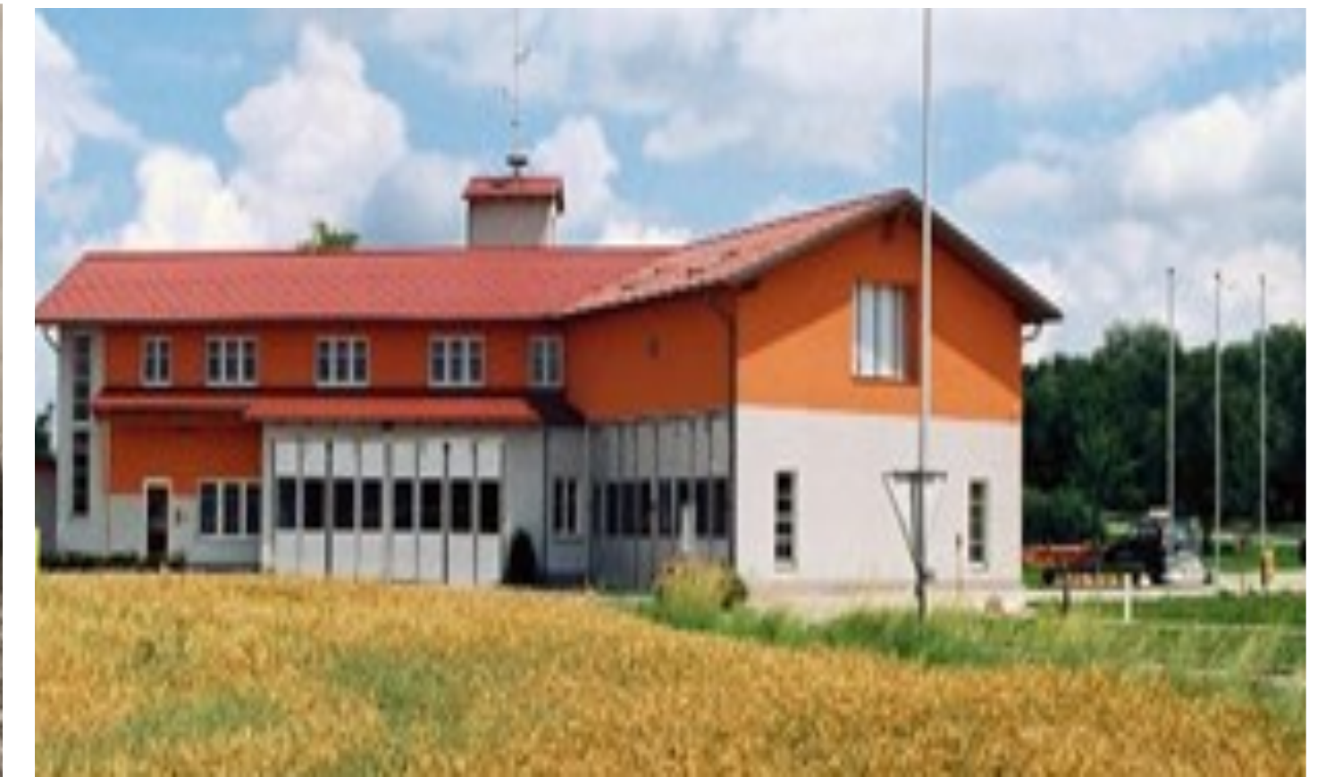
2009 Das neue, moderne Feuerwehrhaus