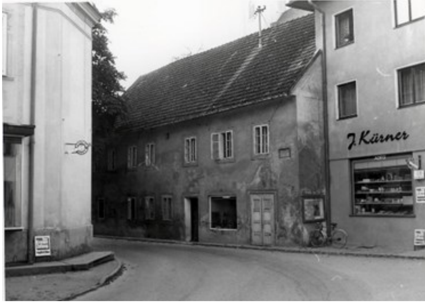
ehem. Pfarrschule an der Friedhofsmauer (1914)