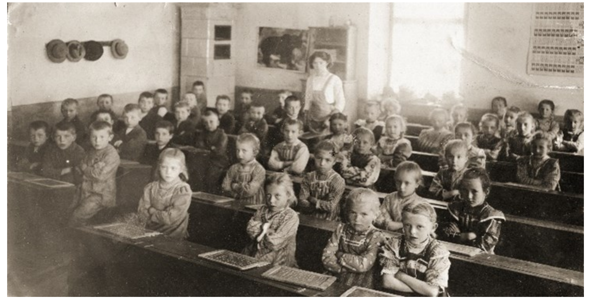
Das älteste bekannte Foto einer Pichler Volksschulklasse aus dem Jahr 1899

Im Jahr 2024/2025 sind 152 Schüler unterrichtet.