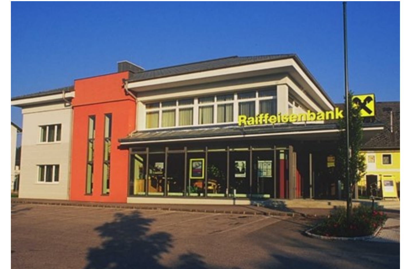
Das Gebäude der Raiffeisenbank Pichl bei Wels vor und nach dem Umbau