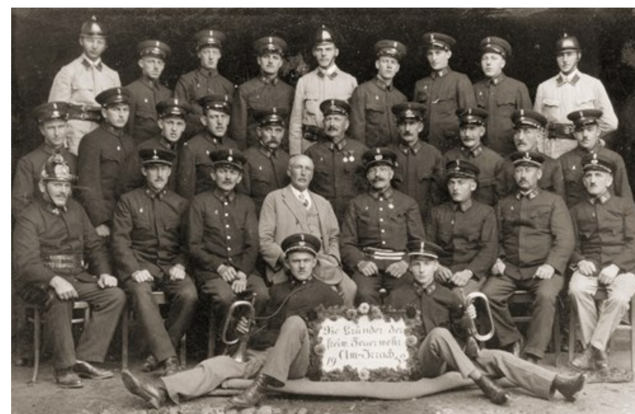
28 Kameraden bei der Gründung 1932