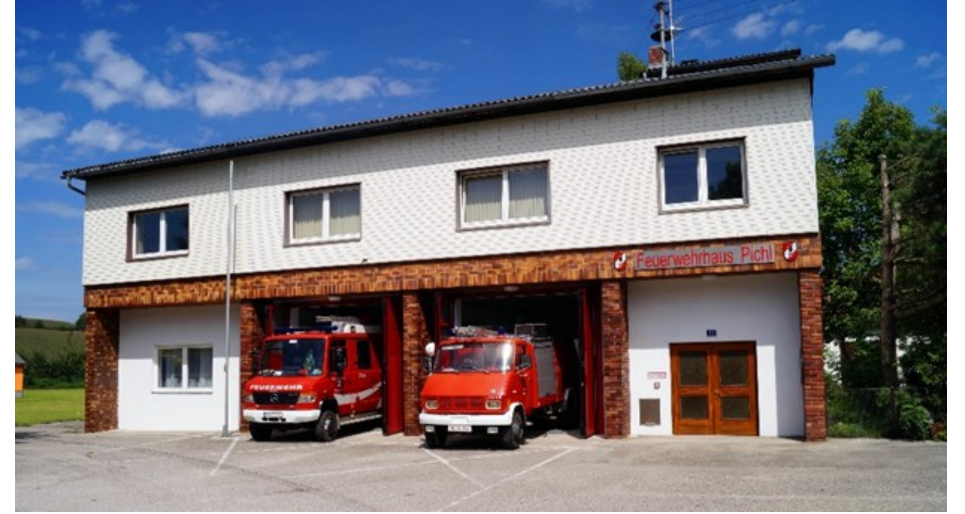
Das Zeughaus der Feuerwehr Pichl im August 2014