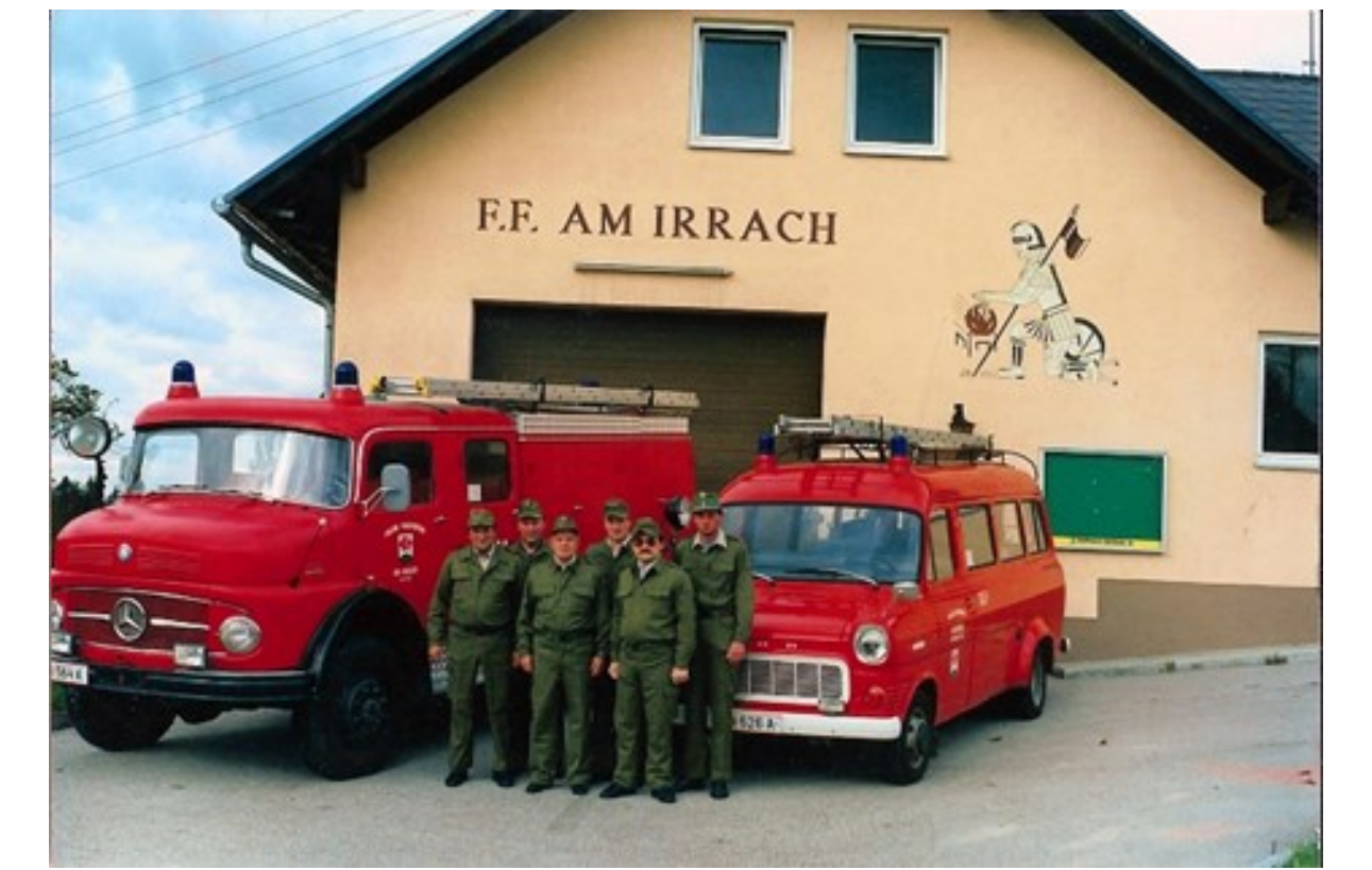
Feuerwehr Am Irrach 1992