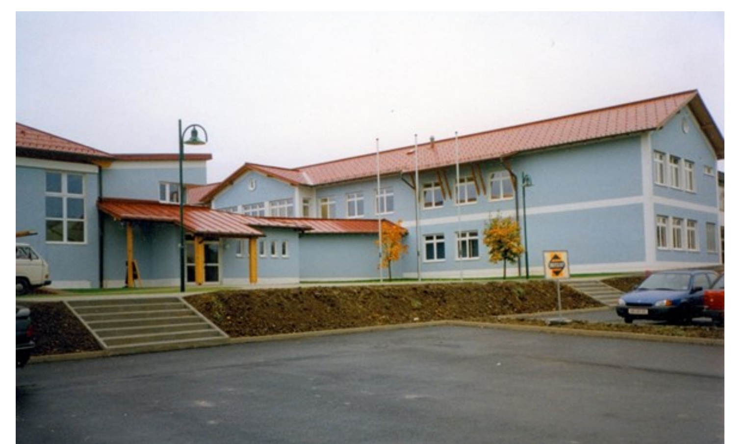
Neuer Klassentrakt und Turnsaal 1997